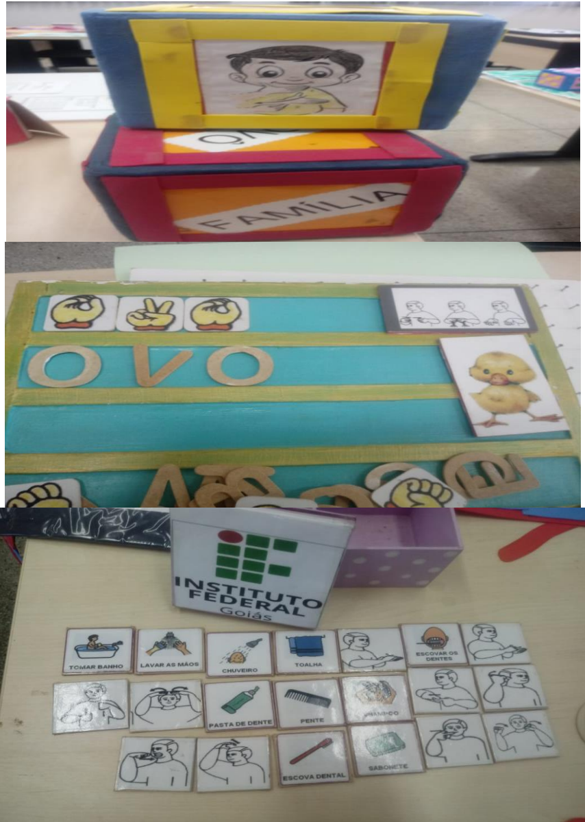
Figura 3 ( Fotografia retirada na faculdade IFG- Instituto Federal de Goiás)