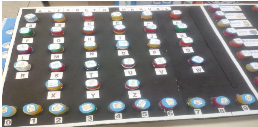
Figura 2 ( Fotografia retirada na faculdade IFG- Instituto Federal de Goiás)