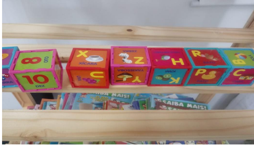
Figura 1( Fotografia retirada na faculdade IFG- Instituto Federal de Goiás)